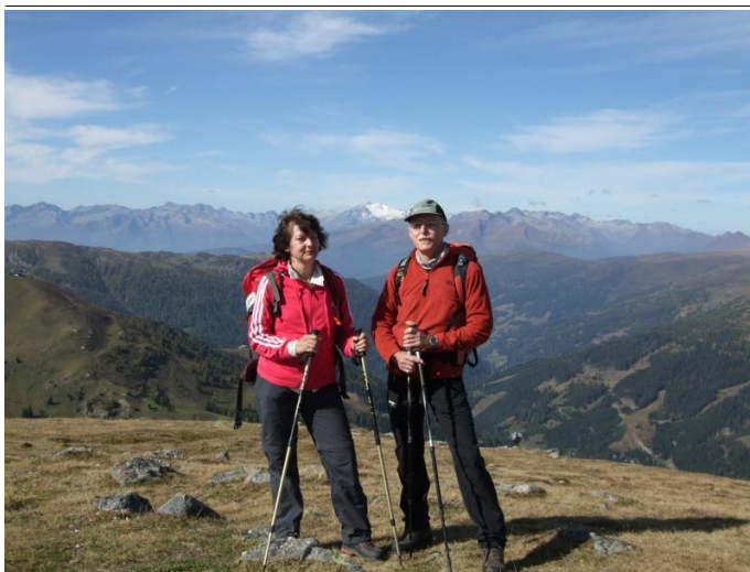
Wanderung auf die Hohe Pressing im Nationalpark Nockberge

Autor: Nationalparkhotel Schihof - Herr Maybrugger